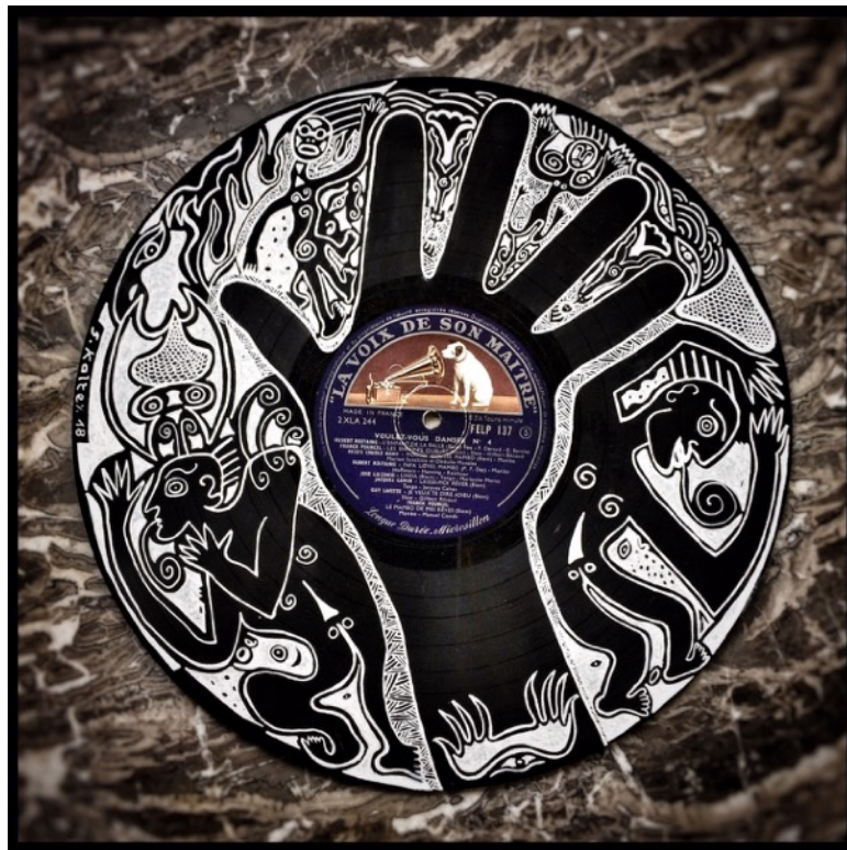
(78 Tours de main, par Soizic Kaltex)